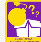
BOMB THREAT SUSPICIOUS PACKAGE